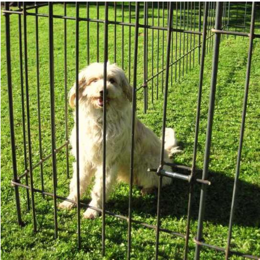
Gartenzaun Modell anneau-195-roh.

Genügend Verbindungsstäbe werden pro Bestellung mitgeliefert.