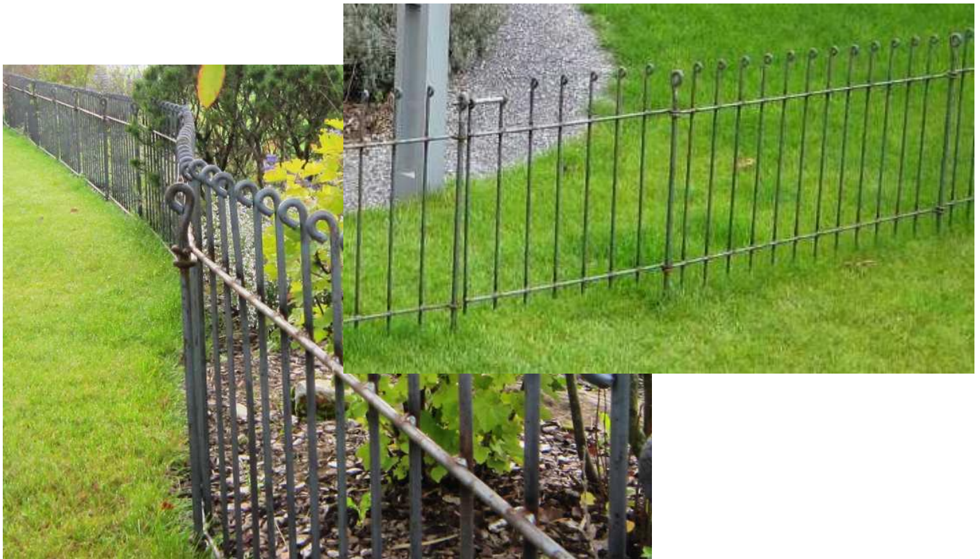
Steckzaun anneau-80-roh im Garten montiert

Damit Sie mit dem letzten Stück auskommen, lassen sich die einzelnen Zaun- und Türelemente in der Breite auf Maß herstellen. Einen Überblick der verschiedenen Zaunbreiten erhalten Sie auf unserer detaillierten Preisliste. Die angegebenen Breiten verstehen sich immer von Mitte Verbindungsstab bis Mitte nächsten Verbindungsstabes, so lassen sich die einzelnen Stücke einfacher zusammenzählen.