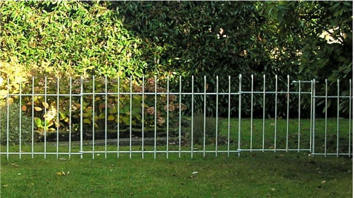
Gartenzaun Modell anneau-80-verzinkt mit Tür, durch die Verzinkung ca. 25 Jahre vor Rost geschützt

Damit Sie mit dem letzten Stück auskommen, lassen sich die einzelnen Zaun- und Türelemente in der Breite auf Maß herstellen. Einen Überblick der verschiedenen Zaunbreiten erhalten Sie auf unserer detaillierten Preisliste. Die angegebenen Breiten verstehen sich immer von Mitte Verbindungsstab bis Mitte nächsten Verbindungsstabes, so lassen sich die einzelnen Stücke einfacher zusammenzählen.